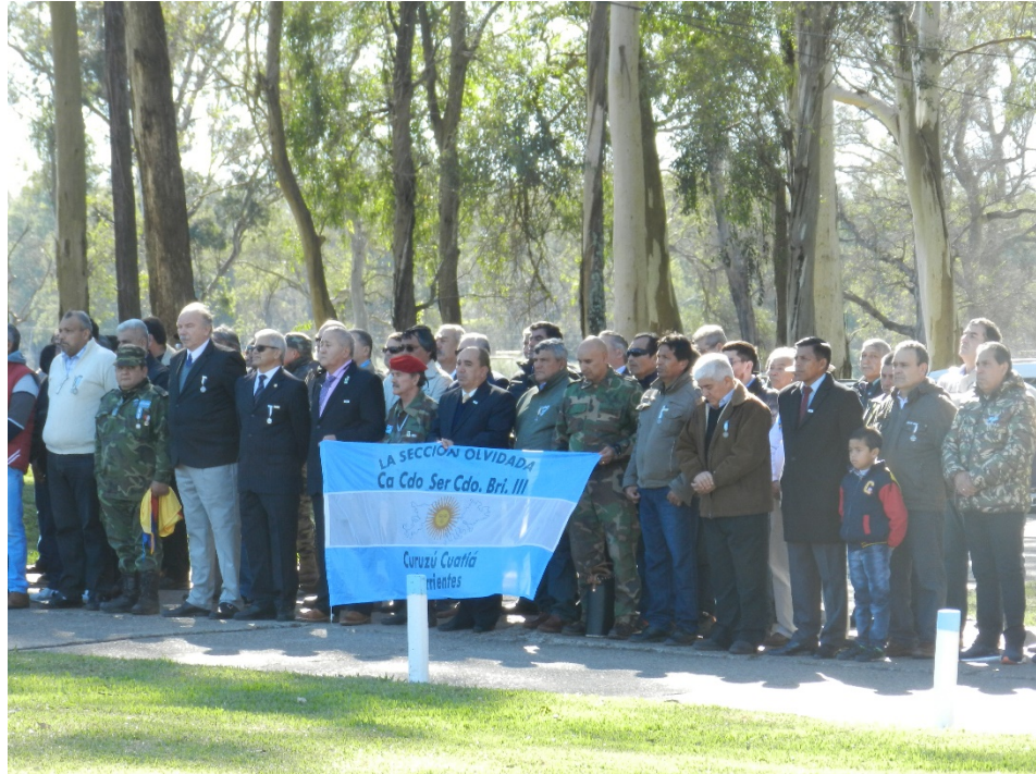
Integrantes de la “Sección olvidada” en la reunión anual de VGM en el RI 4 de Monte Caseros.